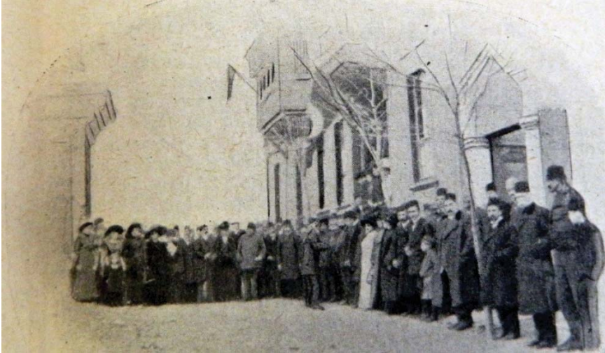
Şekil 3. Edirne İngiliz Okulu açılış günü çekilen birinci toplu fotoğraf (BSPGJ, a.g.e. , Mart 1912, s. 35).