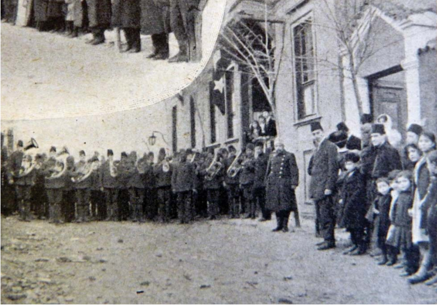
Şekil 4. Edirne İngiliz Okulu açılış günü çekilen ikinci toplu fotoğraf (BSPGJ, a.g.e. , Mart 1912, s. 35).