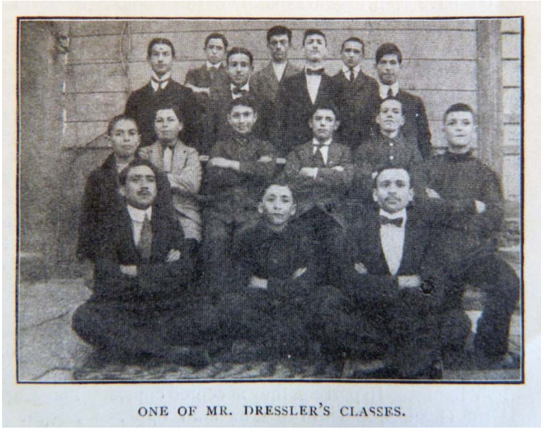
Şekil 8. Dressler'in sınıflarından biri (BSPGJ, a.g.e., Nisan 1914, s. 59).