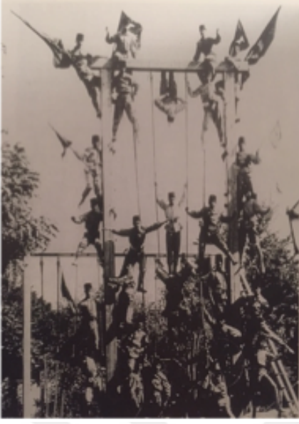
Şekil 1 Harp Okulu Öğrencileri (Yıldız 2002)