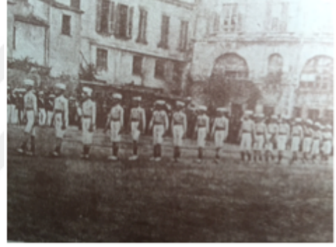
Şekil 7 Okullararası atletizm gösterileri (1910) (Sula Bozis 2011:40)