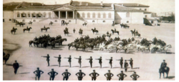
Şekil 2 Mekteb-i Harbiye (www.kho.edu.tr)