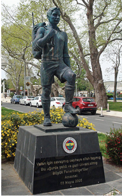
Şekil 16 Kurtuluş Savaşı'na katılmış Fenerbahçe'li sporcuları anmak için yapılan heykel, Fenerbahçe Parkı civarı (www.sihirlitur.com)

politikaları, sosyal olgularıyla birlikte gelişmiş, evrimleşmiş ve endüstrileşmiştir. Bu süreçlerde sporun diğer disiplinlerle ilişkilerine bakıldığında, spor mirasının bugüne kadar ele alınmamış detaylarına ulaşma imkanı bulunabilir. Daha geniş izleyici kitlesine hitap edecek bu spor mirası kesitleri, sporun birleştiriciliğini ve sporun kültürel hayatın ne kadar içine işlemiş bir parçası olduğunu, “sporun sadece idman olmadığını” gösterecektir.