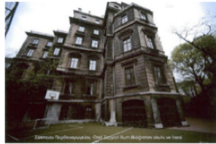
Şekil 6 Zapyon Kız Lisesi

1875'te açılan Taksim'de Zapyon Kız Okulu'nun, 1885'te Tepebaşı'nda inşa edilen yeni binasında fizik laboratuvarı, tiyatro salonu, okuma salonu ve kütüphanenin yanı sıra bir jimnastik salonu da bulunmaktadır (Bozis 2011:57). Bu salon yapım tarihi itibarıyla, İstanbul'daki ilk kapalı jimnastik salonlarından biri olmalıdır. Okulda dans dersleri de verilmektedir. 1904 yılında Zoğrafyon lisesinde beden eğitimi dersi veren İ. Stagalis isimli bir hoca bulunmaktadır (Bozis 2011). 1913 Merkez Rum Kız Okulu raporunda vücudun ruh ile bir bütün olarak gelişmesi için jimnastik dersine ağırlık