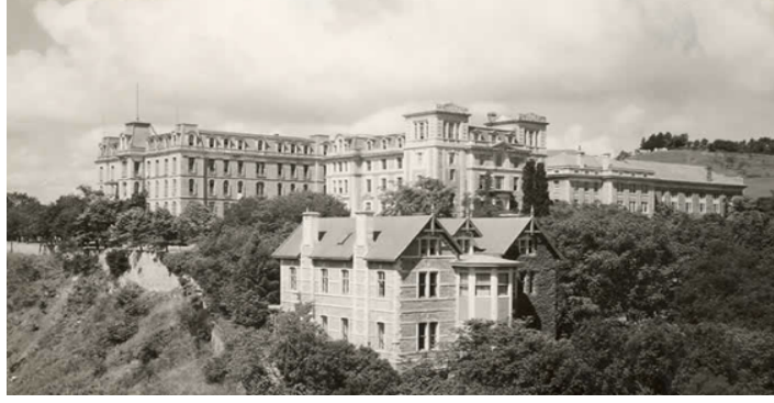
Şekil 10 Robert Kolej kampüsü