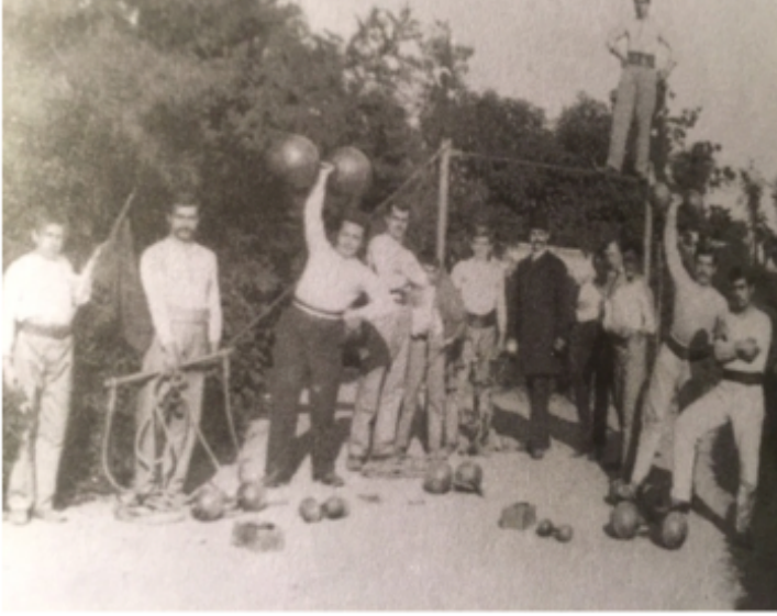
Şekil 4 1880 GS öğrenciler (İst 100 Spor Kulübü 2010:334)

1880'ler ve 1890'lar modern sporların hızla ülkede yaygınlaşmaya başladığı dönemlerdir. 1850'lerde İngiltere'de icat edildiğinden beri Avrupa'yı hızla saran futbol da 1870'lerin sonunda İzmir ve Selanik'te yabancı ve azınlıklarca oynanmış, 1880'lerde de İstanbul'a