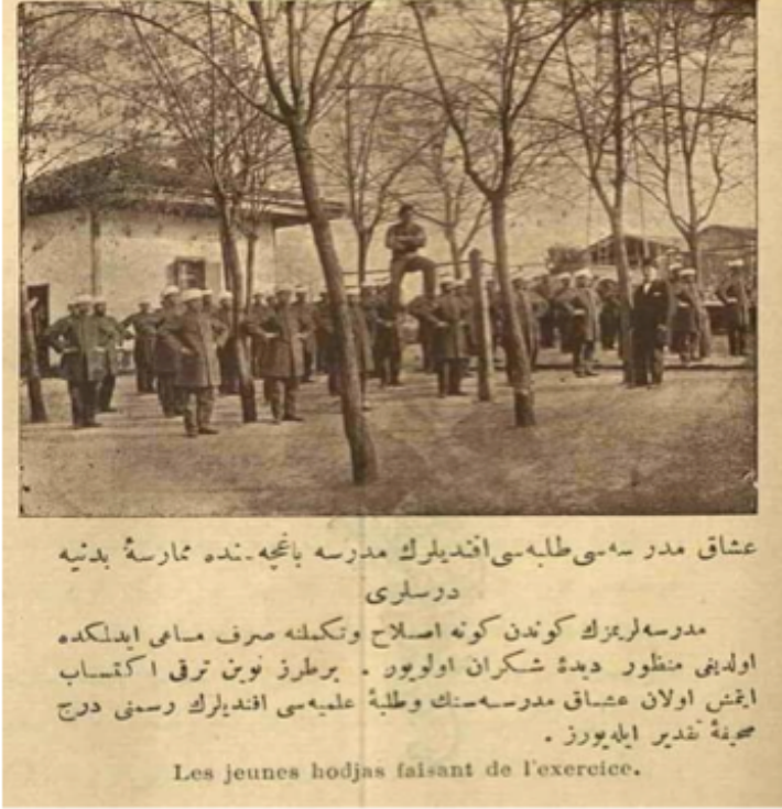
Şekil 5 Servet-i Fünun 1915. no:1258:149

etkilenmişlerdir. Uşak'taki Medresenin bahçesinde beden eğitimi dersi esnasında çekilen ve Servet-i Fünun'da yayınlanan bu fotoğraf sebebiyle, o dönemde medreselerde de fiziksel aktivitelere yer verildiği düşünülebilir.