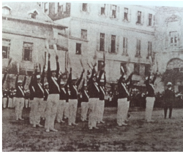
Şekil 9 Hacıhristo Rum Fransız lisesi jimnastik gösterisinde (1900 ) (Sula Bozis 2011:71)