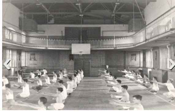
Şekil 11 Dodge Gymnasium (www.gazetevatan.com.tr)

Amerikan Misyonunun daha geç bir uzantısı da YMCA'dır (Young Man's Christian Association). YMCA, 1920'de önce İzmir'de, ardından İstanbul ve Adana gibi şehirlerde şube açmaya başlamıştır. Harun Özmeden çalışmasında, YMCA Türkiye kolunun tıpkı misyon okulları gibi dini faaliyetlerle başladığını ancak kısa süre içinde kendini "spor ve sağlık" sağlayıcı konumuna getirerek donanımlı jimnastikhaneler ve gençlik kamplarıyla hizmet vermeye başladığını söylemektedir (Özmeden 1999:32). Basketbol ve voleybol gibi Amerika'da icat edilmiş oyunların, ülkemize girmesinde YMCA'nın rolü büyüktür. Voleybolu ülkemize ilk YMCA getirmiştir (Özmeden 1999:30). Voleybol daha sonra YMCA'den, spor tarihimizin önemli spor adamı ve Beden Eğitimi Öğretmeni Selim Sırrı Tarcan sayesinde okullara girmiş ve bir okul sporu olarak gelişmiştir. Bugün Türkiye'nin takım sporlarında en başarılı olduğu branşlardan biri olan kadın voleybolu, bunu sporun okul sporu olmasına ve yüksek sayıda kız öğrencinin erken yaşta bu sporla tanışmasına borçludur. 1926'dan itibaren Cumhuriyet döneminde YMCA'nın merkeziyle ilişkilerin bozulması ve mali desteğin azalmasıyla YMCA'nın Türkiye kolu 1928'de kapanmıştır (Özmeden 1999:33).