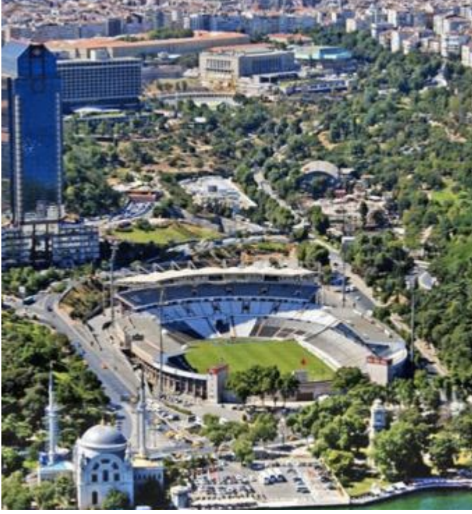
Şekil 14 İnönü Stadyumu

Stadın 1950'lerde geçirdiği isim değişikliklerinden “Sporun Kültürel Miras Değeri”