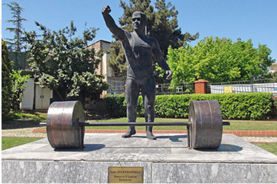
Şekil 12 Naim Süleymanoğlu Heykeli – Levent Sporcular Parkı

Kamusal alana yerleştirilen heykelleri miras göstergesi olarak ayrıcalıklı kılan, heykelin temsil ettiği spor insanını kamusal alanda görünür kılmasıdır. Görsel kültürün önem kazandığı bir dönemde özellikle temsil ettikleri sporcuları fiziksel olarak var etmek ve hatırasını kalıcı ve görünür kılmak amacıyla yapılmışlardır. Sözü edilen sporcu heykellerinin bazıları, sanatsal kaygılardan çok, temsil ve canlandırma önceliğiyle yapıldıklarını düşündürmektedir (Haldun Alagaş, Naim Süleymanoğlu). Sporcu olarak üstün niteliklerinden dolayı bu kişilerin imgelerini kamusal alanda tekrar tekrar görünür kılıp sonraki nesillere aktarılmasını sağlanmaktadır.