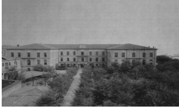
Şekil 3 Mekteb-i Sultani

1868’de Mekteb-i Sultani (Galatasaray) farklı milletlerden gelen öğrencilerin kaynaşmasını amaçlayan bir okul olarak, Fransız Eğitim bakanlığı ile işbirliği içinde bir devlet okulu olarak kurulmuştur. Fransız Lise müfredatı kullanılmıştır. Başta 5 yıllık lise eğitimi verilmiş, sonra ilk ve orta okul için 7 yıl daha eklenmiş ve 12 yıllık bir eğitim kurumu olmuştur. Buna ek olarak 1874’te ise yeni 3 meslek okulu daha açılmıştır: Galatasaray Hukuk Mektebi, Galatasaray Mühendislik Mektebi, Galatasaray Edebi Mektebi. Varlıklı ailelerin oğullarının gittiği paralı bir okul olmakla birlikte, sınavı geçen müslüman çocukların parasız yatılı okumaları da mümkün olmuştur (Somel 2010).