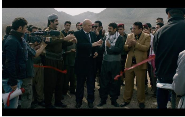
Görsel 6.8. Sahne 54

54. Sahne: Görüntülerin açılması ve tören yapılmaktadır. Burada büyük ve uzun sahneler kullanılmaktadır. Çekimin yapıldığı yer, açılış kurdelesinin kesilmesi ve sahnelerdeki çeşitli endişelerin büyüklüğü gösterilmektedir. Bunlara ek olarak da mekânın genelliği ve yönetmenin kızgın olmasını da eklemek gerekmektedir.