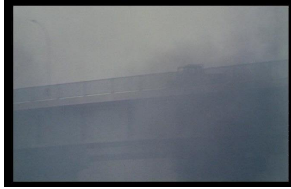
Görsel 4.5. Sahne 5

Eden büyük ve güçlü hegemonyanın neticesidir. Sahnelerdeki genel planın baskınlığı konudaki ezilmişlik duygusunun sinemasal neticesidir. Konu ve sinema dilinin bir birini tamamladığı savının doğrulandığı noktalardır bu genel planlar. Ayrıca üçüncü sahnede karargâhtaki yoldaşlarına erzak götüren iki Peşmergenin yolculuğu yukarıdan çekilmektedir. Burada verilen intibaa, Peşmergelere şüpheyile bakmaktır ve aslında bu dakikadan itibaren birçok sıkıntı vuku bulacaktır. Arap çocuğu Saddam konusundaki anlaşmazlıkla devam edip araba hırsızlığına giden bir silsilenin başlangıcıdır aynı zamanda. Babayla annenin çocukları Saddam'ı nafîle arayışı ve Arap yerleşimcilerin kaba muamelesine maruz kalan Peşmergelerin durumunu anlatan sahnelerde kurulan çekim açıları ve ölçekleri, Arapların da Kürtler gibi ezilmiş olduğunu ve iki tarafta belirgin bir şüphenin varlığını işaretler. İkinci sahnede Peşmergelerin arabayla uzaklaşması ile arabadan çıkan dumanın varlığı hastalıklı gerçeğin halk ve Peşmergeler üzerindeki etkisine işaret etmektedir. Şüphe. Yok ki, arabadan çıkan beyaz duman keyfi değildir. Petrolün Ortadoğu insanının üzerine saçılmasının temsilidir. Böylece bütün ana konuların çekimi açık bir amaç için yapılmıştır.