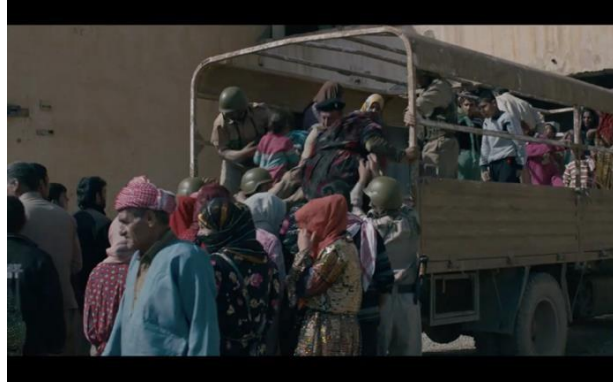
Görsel 6.1. Sahne 73

73. Sahne: Kalenin hapishanesine doğru askeri araçla taşınan ve büyük çoğunluğunu çiftçilerin oluşturduğu ailelerin araçlara bindirilmektedir. Sonra askerler hapishanenin bahçesinde bu insanları indiriyorlar ve bu insanlar yardım çığıllarında bulunmaktadırlar. Kadınların feryatları ve çocukların çığıllarıyla askerler insanları hapishaneye dolduruyorlar. Bu sahne, Enfal katliamını birebir canlandırmaktadır.