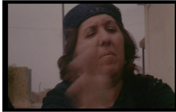
Görsel 4.1. Sahne 4