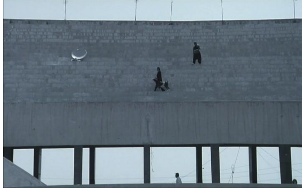
Görsel 5.5. Sahne 6

Çünkü Adam, sanki bir şeytan gibi aniden olayların içerisinde beliriyor ve trajik olayların meydana gelmesinin tadını çıkarıyor. Bu sahnede olan eksikliklere rağmen birçok ayrıntı verilmektedir. Bu sahnedeki boşluğun sebebi ise sonraki sahneler ile olan kopukluktur. Özellikle, zarif Adam ile stadyumda yaşayan göçmenler arasındaki reel toplumsal olaylardaki kopukluk. Bu kopukluk kameranın alt açısı ile sahneye prestij, gariplik ve heyecan verilmesidir.