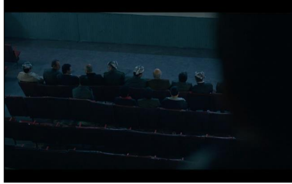
Görsel 6.11. Sahne 1

Bu filmin yükselmesinin en önemli sebeplerinden biri, yeni İtalyan gerçekçiliğinin üslubunu yakalamış olması. Havanın çekimi ve bazı mekanların seçimi ve yönetmenin mekan seçimi çok isabetli. Filmin konusu, büyük bir hapisanede sıkışan binlerce kişinin tutulmasının etrafında dönüyor.