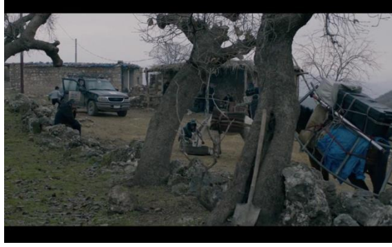
Görsel 6.9. Sahne 43

43. Sahne: Görülmeye değer uzun bir sahne... Sınırdaki İranlı aktrisin kaçırıldığında yönetmeni ve diğer çalışanları taşıyan araba tepeli aşarken görüntüleniyor. Aynı sahnede onların geçişinin engelleniyor fakat, araba aksi yönde gidiyor. Bu sahnede, olaylar karşısında duyguların farklılaşmasını ele alınmaktadır. Bu ise, yönetmenin filminde siyah komediden bazı gizli parçaları kullandığını göstermektedir.