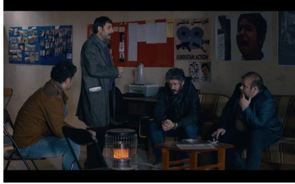
Görsel 6.5. Sahne 7

1 Sahne: Rejim askerlerinden biri sinema salonuna girme sahnesinde yönetmen doğal ışığı kullanıyor. Sahneyi karartmaya ilave odaların dopdolu ve karanlık olması filmin aykırı yönlerindedir.