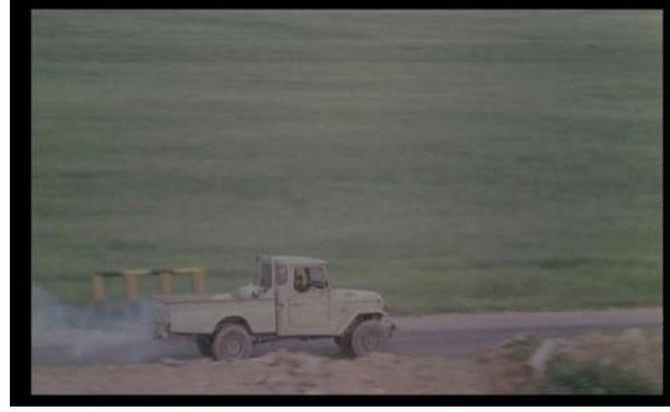
Görsel 4.6. Sahne 6