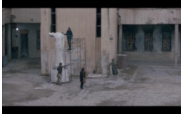
Görsel 6.10. Sahne 23

17. Sahne: Bu uzun sahnede genç kızın film kahramanını olarak seçilmesinin tamamlandığı görülmektedir. Genç kız, gözüktü seviyesindeki bir çekimle film kadrosunun bulunduğu yere gitmektedir. Genç kız, küçük cismi ile gideceği yeri bazı kişilere sorar. Bu durum genç kızın, kendisi ile ilgili bir şey bilmediği bir âleme girmedeki korku ve endişesini göstermektedir.