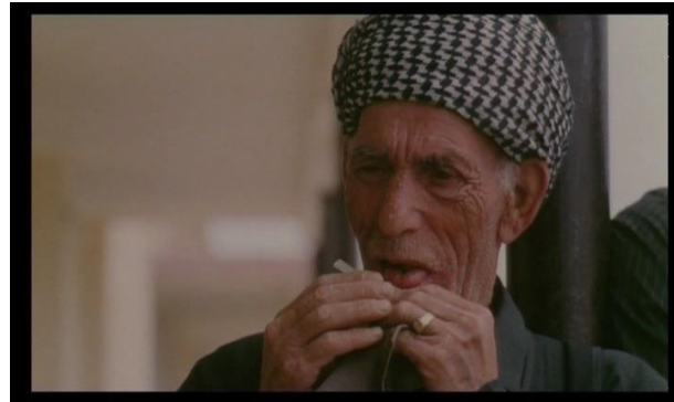
Görsel 4.7. Sahne 4

Birinci sahnenin başında bir kadının ekmek ellerini uzun odaklı objektifin yardımıyla görürüz. Bunu takip Eden planlarda ekmek yapan kadınlar ve ayrıca Saddam'ın düşmesini televizyondan izleyen insanların tepkilerini görürüz. Yaşlı bir adamın sigara sarıp olan bitene gülümsemesi yine uzun odaklı objektifle yansıtılır. Tüm bu enstantanelerin varlığının dramatik yapıyla bir bağlantısı yoktur sadece amaç doğal/amatör oyunculukla filmin gerçekliğini arttırmaya katkı sağlamaktır. Uzun odaklı objektif kullanımı çekim esnasında amatör oyuncuya kameranın kendisini çektiğini hissettirmeden gerçekleştirebilmesi dolayısıyla tercih edilmiştir. Böylelikle amatör oyuncuların otomatik olarak gerçekleştirdikleri fiziksel hareketlerle realist çekimler meydana getirilmiştir.