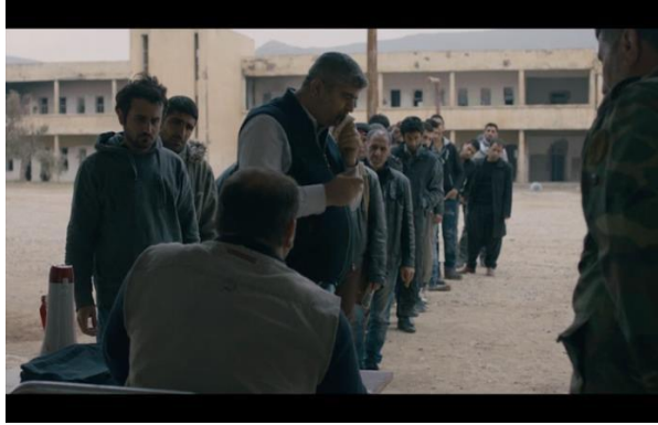
Görsel 6.3. Sahne 66

66. Sahne: Filmin idarecilerinden biri filmin bazı sahnelerinde oynayan figüranlara ücretlerini vermektedir. Bu sahnede büyük bir figüran topluluğu kendilerine tahsis edilmiş ücretlerini almak için uzunca bir sıra oluşturuyorlar. Yönetmen burada filmin imkânlarının kısıtlı olduğunu göstermek istiyor. Figüranlardan bazıları ücretlerini alırken büyük çoğunluğu paranın AZ olmasından dolayı görevliyle tüm güçleri ile çatışmaktadırlar. Yönetmen, bu sahnede ihtiyaçlarını gidermek için küçük rollerde oynamak isteyen bir topluluğun yoksulluk derecesini göstermek istemektedir. Yine yönetmen, yoksulluklarının boyutunu göstermek için onların kırık iskemlelerin üzerinde dururken tasvir etmeyi denemekten de geri kalmamaktadır.