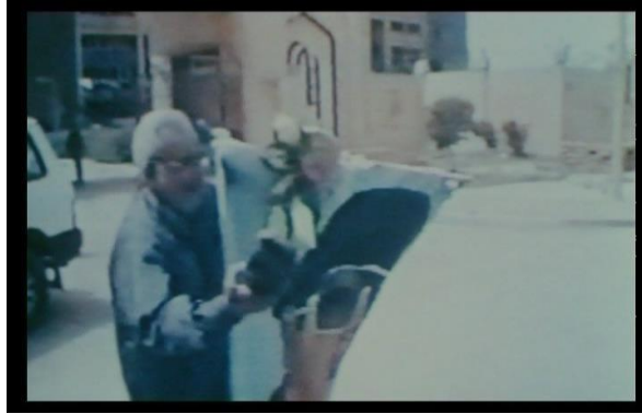
Görsel 4.9. Sahne 3

İtfaiyeler şehrin caddelerinde hızlıca gidip gelmekte ve çekimlerin genelinde kutlama yapan gençler bulunmaktadır. Yaşlıca bir Kürt kadını çarşafını üzerinden kaldırıp insanların ortasında dans etmektedir. Amerika askerleri silahları ile farklı yönlere doğru nişan almaktadır. Birçok görüntüde Arap ve Kürt göstericileri Saddam birliklerinin olduğu yerleri yaktığı görülmektedir. Sonra havalarda uçan Amerikan uçakları görüntüsü verilmektedir. En meşhur görüntü ise, Arap adamın ayakkabıları ile Saddam büstünü dövdüğü görüntüdür. O Adam izleyicilere dönük görüntüsü ile çektikleri çilelerin ve yıkımların sebebinin Saddam olduğunu bağırarak haykırmaktadır. Amerika askerlerinin bir bölgeyi ele geçirme görüntüleri de verilmekte ve bu belgesel görüntüler, filmin doğal dramatik çizgisini ortaya çıkarmaktadır. Bu tür dramatiği temsil Eden sahneler, hakim güç ile halk arasındaki ilişkiyi en iyi şekilde vermekten başka bir şey değildir. Bu görüntüler, kendisine kızgın bir halkın olduğu, bir rejimi göstermektedir. Bize yapılan açıklamalar hayatın karanlık evresinin açıklamalarıdır.