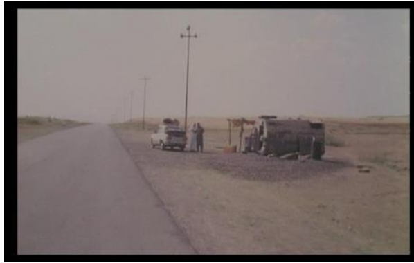
Görsel 4.3. Sahne 22

Amerikalıların gelişi ile eski külüstür araçlarımızı yeni olanlarla değiştireceğiz.” der. Sonra iki Peşmerge ve benzin satıcısı arasında, savaş ve abluka dolayısı ile fiyatı 70 dinara ulaşan benzin fiyatı ile ilgili bir diyalog geçer. Peşmergenin benzin fiyatları ile ilgili bir kanaatinin olmamasına rağmen benzin satıcısının kendisine fiyatlarla ilgili söylediği “Gerçek budur, alternatifimiz yok.” sözünden de anlaşılabilir. Peşmerge, Amerikan arabasından İngilizce çağırdığı benzin satıcısına baktığı sırada, benzinci kendisine “Bak! O bülbül gibi olan dilimdir.” der ve şunu da ekler “Amerikalıların varlığıyla hayat daha güzel olacak.” Burada Saddam rejimi eliyle yapılan katı züllumün vatandaşlar üzerinde görünen aşırı kinin büyüklüğü ortaya çıkmaktadır. Benzinci Amerikalılar ile sürdürülecek bir hayatı Saddam ile yaşanılacak hayata tercih etmektedir. Onlar, küçük kapları doldurmak yerine benzin ve gaz gibi büyük hazineleri büyük varillere dolduracaklar. Benzinci, kendini zorlamadan hayatının değişeceğini haber vermekte, yaşadığı savaş ve abluka yıllarından sonra hayatının daha fazla müreffeh olacağına işaret edercesine konuşmaktadır. Benzinci, Arapların Saddam’ı idam edeceklerini de ekler.