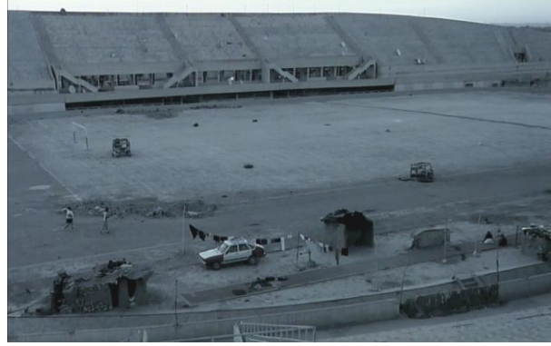
Görsel 5.8. Sahne 27

Bu sahneden sonra da Asu ve Diyar'ın gece sahnesi gelmekte, ondan sonra da stadyumdaki antrenman çalışmaları gelmektedir. Asu ve Saku hızlı çekimli sahnelerde dolu fotografik bir hava olan hoş görünümlü, geniş ve açık bir alanda belirmekteler. Ayrıca bu sahnelerle beraber gelecek sahneleri geliştirilmesi için seyirciler ve oyuncuların önünde tamamıyla açık olan uzaya terkedilir. Bu ise, enerji özgürlüğünün stadyumun geniş alanına yeterince çıkması için. Yapılmaktadır. Bu sahne toplumsal olarak, eğlence ve oyunları bilmekten yoksun topluma yeni bir diyaloga odak oluşturmaktadır. Bu mesaj özellikle, Asu ve Kasu'nun pistte koşuşturmaları sırasında sıkılan uyuklu adamlar ile verilmektedir.