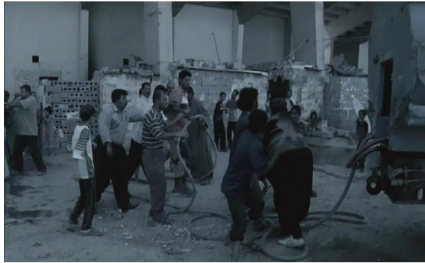
Görsel 5.6. Sahne 14

Bütün herkes su alabilmek için mücadele vermekte ve aileler arasındaki su taksimi koordinasyonu