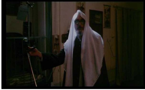
Görsel 4.4.Sahne 32

Peşmerge ile konuşma eğilimi olmayan camiden sorumlu din adamı sahnesinde bu durumu