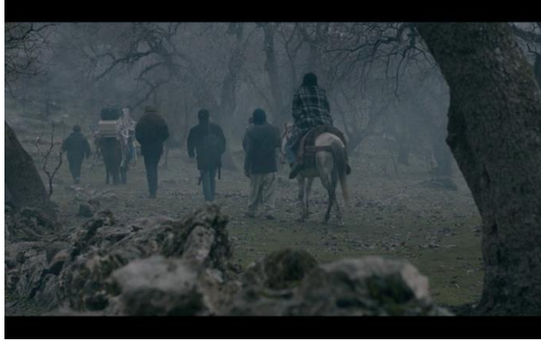
Görsel 6.4. Sahne 47

47. Sahne: İranlı aktrisin eşekle kaçırılması operasyonunda prodüksiyon imkanlarının yoksunluğunu fark ediyoruz. Olayın derin hissedilmesinde rol oynayan doğal ışıklandırmayı kullanılması bakımından film başarılı olmaktadır. Özellikle de filmde kullanılan hapishanenin gerçek olması ve bu çok az ışık alan hapishanenin doğal olarak ışıklandırmanın kullanılması dikkat çekicidir. Bu durum ise yönetmen için iyi bir fırsata dönüşmektedir.