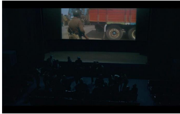
Görsel 6.6. Sahne 1

1 Sahne: Rejim askerlerinden biri sinema salonuna girme sahnesinde yönetmen doğal ışığı kullanıyor. Sahneyi karartmaya ilave odaların dopdolu ve karanlık olması filmin aykırı yönlerindedir.