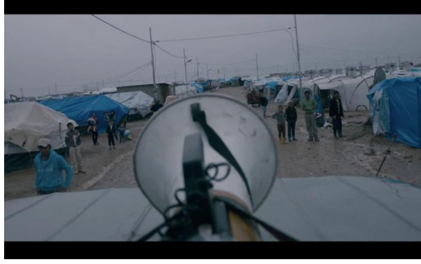
Görsel 6.2. Sahne 62

66. Sahne: Filmin idarecilerinden biri filmin bazı sahnelerinde oynayan figüranlara ücretlerini vermektedir. Bu sahnede büyük bir figüran topluluğu kendilerine tahsis edilmiş ücretlerini almak için uzunca bir sıra oluşturuyorlar. Yönetmen burada filmin imkânlarının kısıtlı olduğunu göstermek istiyor. Figüranlardan bazıları ücretlerini alırken büyük çoğunluğu paranın AZ olmasından dolayı görevliyle tüm güçleri ile çatışmaktadırlar. Yönetmen, bu sahnede ihtiyaçlarını gidermek için küçük rollerde oynamak isteyen bir topluluğun yoksulluk derecesini göstermek istemektedir. Yine yönetmen, yoksulluklarının boyutunu göstermek için onların kırık iskemlelerin üzerinde dururken tasvir etmeyi denemekten de geri kalmamaktadır.