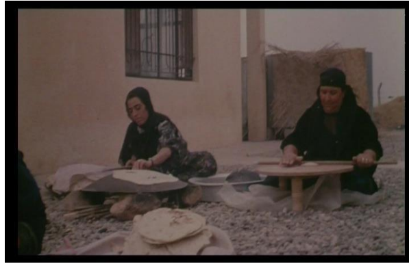
Görsel 4.2. Sahne 4

Yoksulluğunun rahatlıkla okunabildiği yaşlı bir adamın görüntüsü ekrana gelir. Bazı kişiler sigara sararken gülümseyerek televizyona bakmaktadırlar. Gösterilen enstantanelerin arasına elinde Kürt müziğinde kullanılan bir tür zurna çeşidi olan Şimşal'i çalmak için hazırlanan birini görürüz. Şimşal genellikle kutlamalarda kullanılır. Herkes sabırsızlıkla Amerikalıların eliyle düşürülmekte olan Saddam heykelini izlemektedir. Saddam heykelinin düşürülmesi görüntüleri ile tüm insanlar, Şimşal ve asma davul eşliğinde, geleneksel elbiseleriyle çılginca eğlenmeye başlarlar. Onların hepsi tarihi bir anda toplanmış yoksullardır. Onların hepsi hâkim sınıfın ve Saddam rejiminin zulmünden aşırı bir şekilde etkilenmiş ve bu kor ateşten kurtulmayı bekleyen Kürtlerin bir kısmıdır.