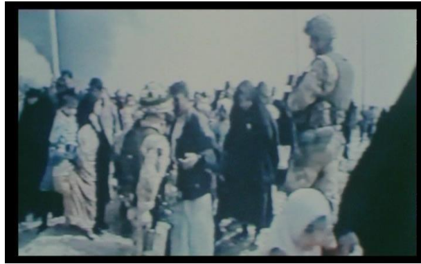
Görsel 4.8. Sahne 2

Üçüncü Sahne: Yönetmen, 3:45 ve 5:23 dakikaları aralığında Saddam rejiminin düşmesi ile sevinen Irak halkının belgesel görüntülerini kullanmaktadır. Bu çekimlerin çoğu televizyon kanallarından alınmadır. Şahsi kamera ile çekilen görüntüler de vardır. Özellikle Amerika askerlerinin tanklar üzerindeki görüntüleri olmak üzere, Amerika askerlerinin sokaklara çıkıp çektiği görüntüler de kullanılmaktadır. Kürdistan bayraklarıyla birlikte insanlar, farklı bayrakları başları üzerinde taşıyorlar ve Saddam Hüseyin'in duvar imajını yakıyorlar.