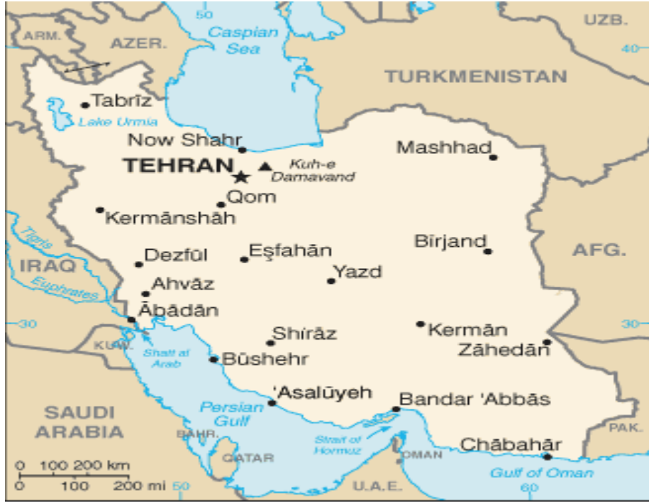
Harita 1: İran