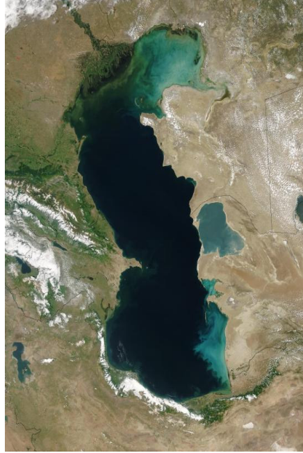
Resim 2: Hazar Denizi'nin Uydudan Görüntüsü

Kaynak: http://tr.wikipedia.org/wiki/Hazar_Denizi