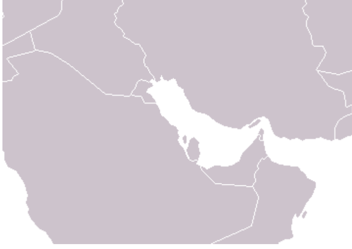
Resim 3: Basra Körfezi