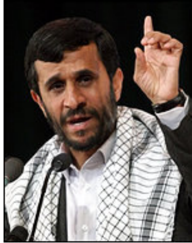
Resim 1: İran Cumhurbaşkanı Mahmud Ahmedinejad

Bu kontrole alakalı dünyada geniş yankı bulan olay; 2006 yılı Ocak ayında yaşanan, İran asıllı CNN muhabiri olan Christian Amanpour'un İran Cumhurbaşkanı Mahmud Ahmedinejad'ın basın toplantısında söylediğı sözler olan “Nükleer enerji hakkımızdır” yerine “Nükleer Silah hakkımızdır” şeklinde yanlış tercüme edilmesinden ve dünya basınında bu şekilde duyurulmasından kaynaklanan, uluslararası kanalın ülkedeki yayınına yasak getirilmesidir ve İran Kültür Bakanlığı'ndan bir yetkilinin yaptığı bir açıklamada CNN muhabirlerinin bile ülkeye giremeyecekleri belirtilmiştir. Fakat daha sonradan CNN televizyonunun aralarında CNN International, CNNUSA ve CNN. com'un bulunduğu bütün kanallarından özür dilediğı, ayrıca İran hükümetinin yanı sıra İran'ın BM nezdindeki büyükelçisinden de özür dilediğı belirtildikten sonra Cumhurbaşkanı Ahmedinejad tarafından affedilerek tekrardan yayınına başlamıştır. 25