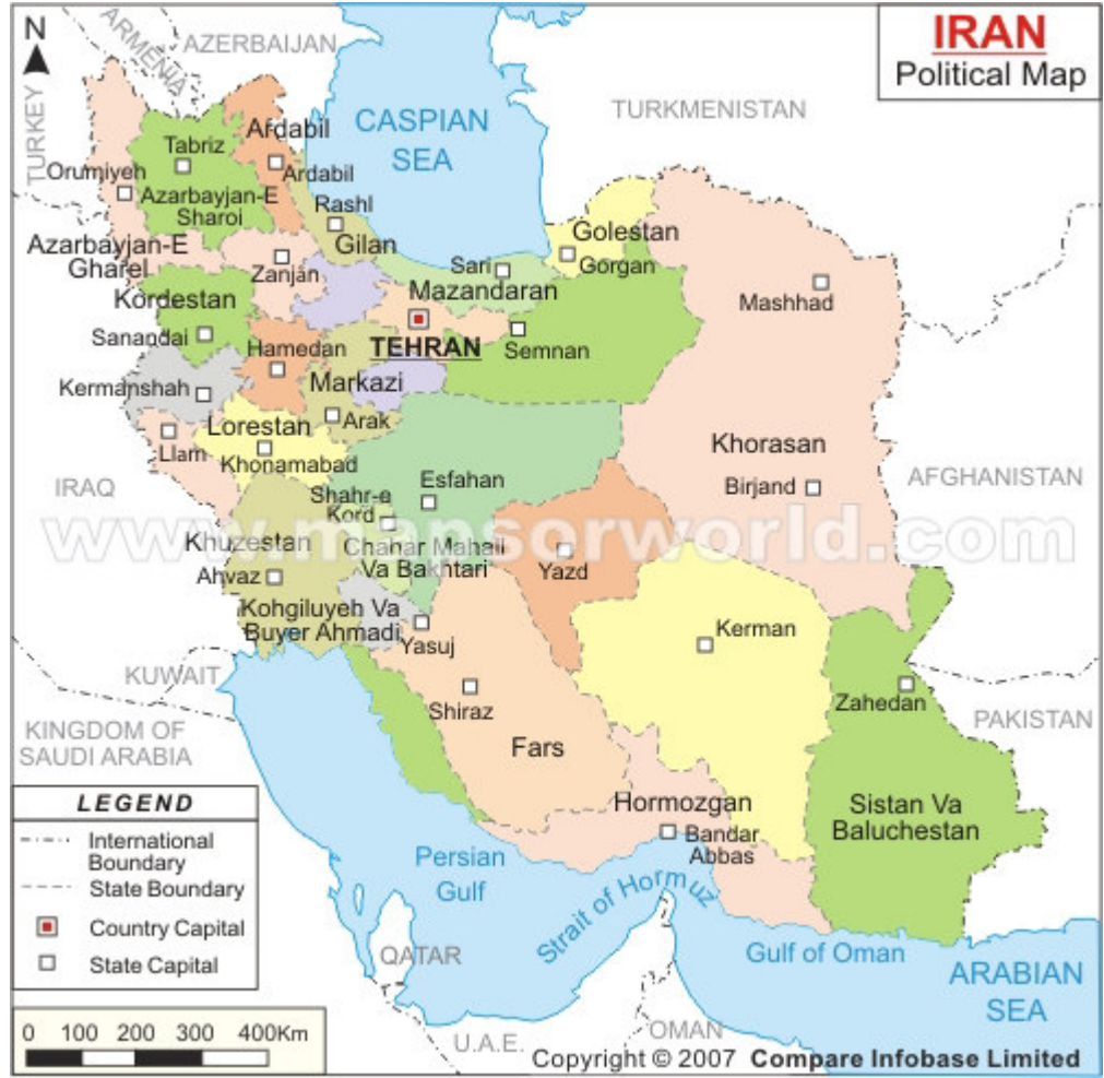
Harita 2: İran'ın Etnik Bölge Haritası