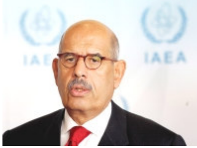
Resim: 5 UAİK Başkanı Muhammed El-Baradeı