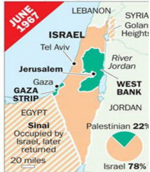
Victory in Six-Day War vastly expand Israeli-controlled territory