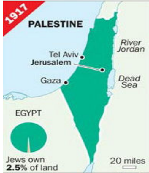
Palestine before creation of Israel