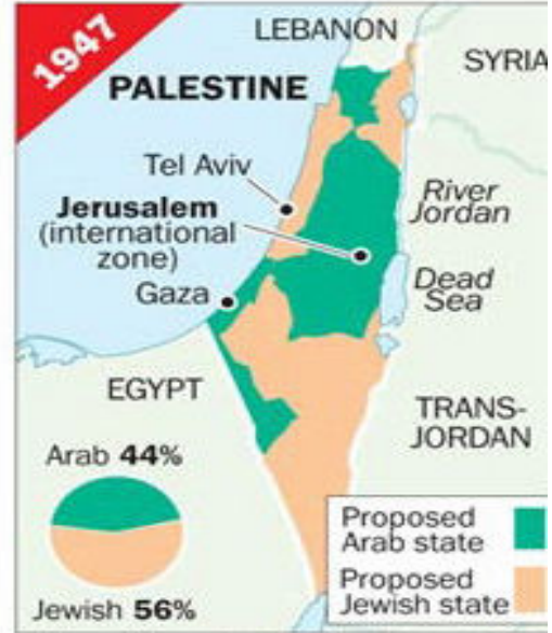
UN partition plan for Jewish and Arab states. Rejected by Arabs