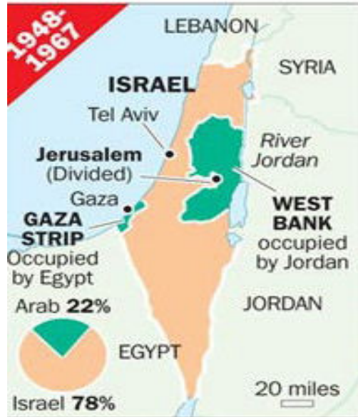
Limits of newly-created Israel