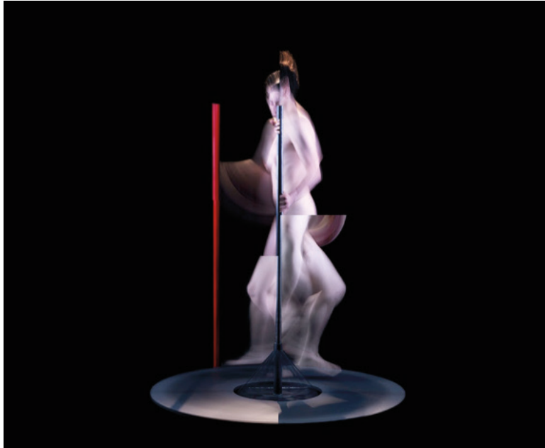
Görsel 3: Ahmet Elhan, Gergedanlaşma, 2014

'Mürekkep II'de çözümlenebilen bir mekân kullanılmasına karşın, karanlığın içine hapsedilmiş 'Gergedanlaşma' isimli çalışmasında Ahmet Elhan, dönüşümün birey açısından yarattığı güçlüğü ve verdiği acıyı hissettirmektedir. 'Gergedanlaşma'da beden yaşamsal özelliklerini yitirecek kadar çok parçalara ayrılmış durumdadır. Parçalanmış eril bedenin üzerinde dönüp durduğu yuvarlak yüzeyin dişiliği sembolize ettiği düşünülebilir. İktidarı simgeleyen kırmızı direğin ise bu yüzeyin dışında bırakıldığı şeklinde yorumlanabilir.