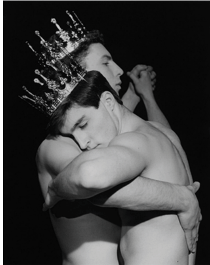
Görsel 10: Robert Mapplethorpe, Dans Eden İki Adam, 1984, siyah beyaz fotoğraf

İki erkeğin birbirine sadakatle eşlik ettiği dans fotoğrafı, estetik görünümüyle ve yansıttığı duyguyla izleyicinin algı düzeyiyle barışık bir görünüme sahiptir.