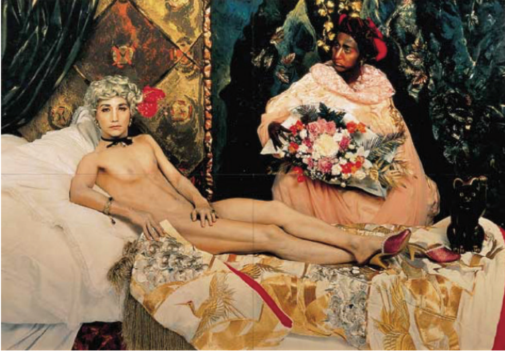
Görsel 6: Yasumasa Morimura, Futago , 1988.

Dişi rolüne girmiş olan eril beden, izleyiciyle birlikte resimdeki zenci kadın hizmetçiyi de şaşırtmaktadır. Hizmetçi tüm şaşkınlığına rağmen, dişil erkek bedene hizmet etmekte ve bu bedenin dişiliğini tasdikleyen çiçek buketini taşımaktadır. Kıllarına ve kaslı yapısına rağmen uzanmış çıplak beden, bilinen Venüs pozuyla dişil olduğunu kabul ettirmiş, Manet'nin Olympia 'sında olduğu gibi davetkâr bir dişi pozuna bürünmüştür. Bir eliyle cinsel uzvunu davetkâr bir tavırla gizlerken diğer eliyle geleneksel Japon desenli örtüyü tutmakta, örtmek ile göstermek arasında dişil bir duyguyu yansıtmaktadır. Manet'in klasik Venüs yorumunu yerle bir eden 1860'lı yıllara ait Olympia 'sını, 1988 tarihinde eşcinsellik açısından yeniden yorumlayan Morimura'nın, dişil duygu yorumu, günümüz kadın davranışlarını tam olarak yansıtmamaktadır. Eşcinsel duygusunun da kadın duygusuyla aynı olduğunu söyleyemeyeceğimiz gibi, Morimura'nın eserinin izleyicisi olarak, klasik Venüs pozunu ile bu iki farklı duyguyu eşleştirmekte zorlanabiliriz. Dolayısıyla Morimura bu eseriyle oldukça çetrefilli ve riskli bir durum yaratmıştır. Yüzyıllarca bilinen yerleşik Venüs algısını yapıbozuma uğratan Manet'nin eserini aradan yüz yıl geçtikten sonra eşcinsellik algısı katarak yeniden yorumlamış olması, izleyiciyi Rönesans dönemine kadar geri götürmekte, bilinçaltındaki bedene ilişkin tüm imgelerini ve göstergelerini yerinden oynatmaktadır.