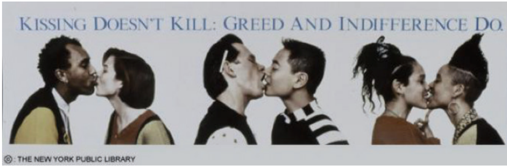
Görsel 11: Gran Fury, Öpüşmek Öldürmez: Açgözlülük ve Kayıtsızlık Öldürür, 1989. Otobüs Afişi.

Otobüs afişinde farklı cinsel birliktelikler bir arada ve aynı sıradanlıkta gösterilmiştir. Slogan formundaki "Öpüşmek öldürmez: Açgözlülük ve kayıtsızlık öldürür" mesajı ise toplumu ahlakla ilgili karşılaştırmalı bir sorgulamaya yönlendirmektedir. Gran Fury grubu, bu eseri kamusal alanda diğer sıradan reklam görüntüleri arasında sergileyerek sanatın hedef kitesini genişletmiş ve ara cinsel kimlikleri normalleştirmeye katkı sağlamıştır.