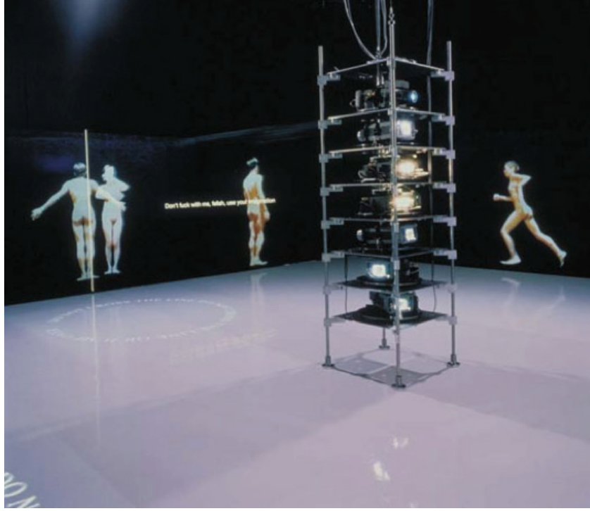
Görsel 1: Teiji Furuhashi, Aşkılar , 1994-95.

Verdiği mesajlarla Furuhashi, genel anlamıyla toplumsal cinsiyet baskılarına ve zorunlu heteroseksüelliğe karşı çıkmaktadır. Sanatçı, mekânda kurguladığı düzenle farklı geçişlere olanak sağlayan alternatif cinsel ilişkiler önermektedir. Bununla birlikte, farklı birliklikleri izleyicilerin zihninde canlandırmasını sağlamak amacıyla 'hayal gücünü kullan' söylemini kullanmaktadır.