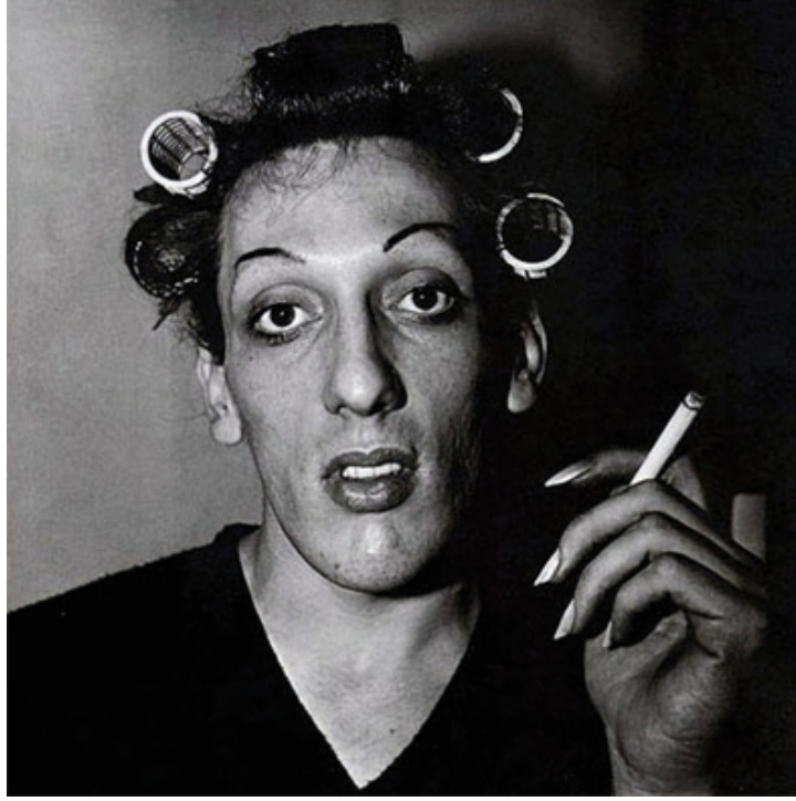
Görsel 4: Diane Arbus, Bigudili Genç Adam, 1966, Jelatin Gümüş Baskı

Diane Arbus'un fotoğrafladığı bu genç adam, bigudileri, alınmış kaşları ve boyalı tırnaklarıyla objektife dışıl bir ifadeyle bakarken diğer taraftan halen eril görünümünü de korumaktadır. Toplumun bedeninden beledikleriyle bedeninin sunmak istedikleri arasında sıkışıp kalmıştır. Bu çaresizliği ile kendisini ifade etme isteği arasında bir çelişki yaşamaktadır. Toplum içinde benimsenen göstergelerden farklı olarak kendisine yeni bir cinsel kimlik göstergesi sağlayacak görünüme bürünmeye çalışan bigudili genç adamın gözleri, yaşadığı toplumsal baskıyı unutmaya çalışırcasına bizim göremeyeceğimiz kadar uzakta boş bir noktaya odaklanmış ya da odak noktasını boş vermiş olabilir. Ruhu, toplumsal sistemin dışladığı boşluk içinde yüzer gibidir.