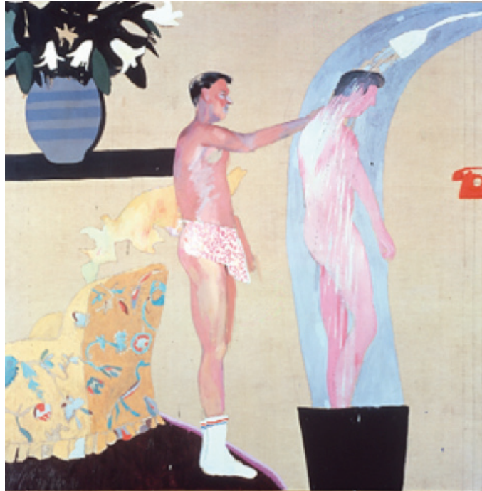
Görsel 9: David Hockney, Ev Hayatından Bir Sahne , 1963, tuval üzerine yağlıboya

Gey bireylerin günlük sıradan hallerinin nadiren karşımıza çıkmakta olması, toplumsal algıda kabul görmeyi geciktirmektedir. Sanat, gey kimliklerin günlük sahnelerini görsel olarak aktarmada ve yaygınlaştırmada önemli bir araç haline gelmiştir.