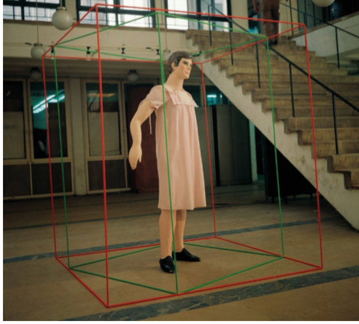
Görsel 5: Gülsün Karamustafa, Çifte Hakikat, 1987

Bedenin dışındaki kübik formların, hem bedenin kendi sınırlarını çizdiğini hem de izleyicinin beden üzerindeki müdahalesini sınırladığını düşünebiliriz. Bu açıdan bakıldığında, iç taraftaki yeşil kübik form oyuncak bedenin geçebildiği alanı oluşturmakta, kırmızı kübik form ise hem bedenin dışarıya çıkmasını engellemekte hem de izleyiciyi içeriye almamaktadır. Bu çetrefilli cinsel kimlik bulmacasında bulanıklaşan zihinler, düşüncelerini içeriye hapsetmek zordur. İzleyici, rahatsızlığını dile getirirse de onu duyabilecek gerçek bir bedenle değil, kurmaca oyuncak bir bedenle karşı karşıyadır. Bedeni oyuncaklaştıran ve çelişkilere sürükleyen ise toplumun önyargıdır.