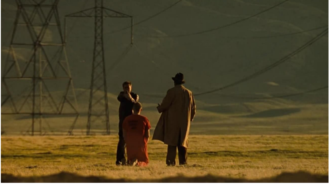
Görsel 4.1: Mills'in Doe'yu öldürdüğü final sahnesi. (David Fincher, 1995)

David Fincher'in yönettiği Yedi (1995), kendisini mesihsel bir karakter olarak sunan, Hıristiyan inancına göre yedi ölümcül günahı temsilen işlediği yedi cinayet ile toplumdaki ahlaksızlıklar ve insanların davranışlarındaki aşırılıklar hakkında vaaz ederek topluma nizam vermeye çalışan bir dini fanatik hakkındadır. Hıristiyanlıktaki yedi ölümcül günahı rehber edinen John Doe (Kevin Spacey) günahkarları cezalandırarak adalet sağlayan bir kişidir.