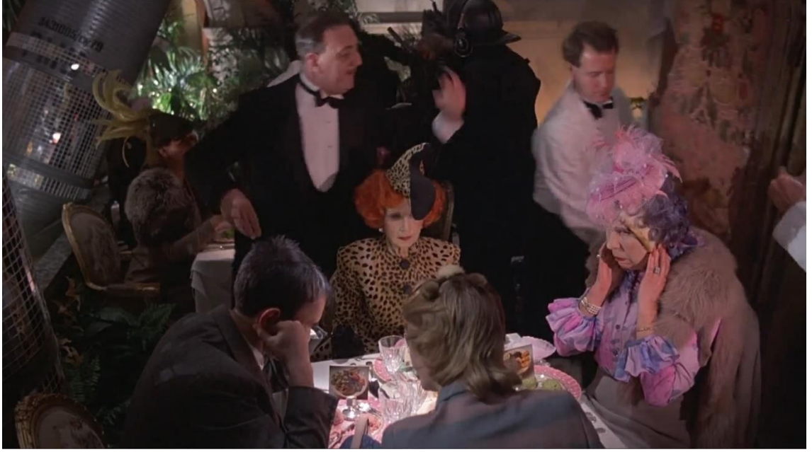
Görsel 4.3: Restoranda gerçekleşen patlama sonrası masadaki dörtlünün arkada can çekişen insanları görmemeleri için paravan çekiliyor. (Terry Gilliam, 1985)

“Totalitarizmle ilgili literatürün tuhafılarından biri totalitarizmin (kusursuz kaynakların eksikliği ve aşırı duygusal bağılıklardan dolayı akademik kaidelerin tamamını iflas ettiren) ‘tarihini’ yazmaya dönük ilk girişimlerde bulunan kimselerin zaman sınavını başarıyla vermiş olmalarıdır.” (Arendt, 2014, s. 17-18) Hannah Arendt, Totalitarizm ’e yazdığı önsözde kitabın erken bir tarihte yazılmış olmasının bir handikap yaratmadığını ve geçmişte yazılanların bugünün bilgileriyle doğrulandığını, dolayısıyla totalitarizm fenomeninin güncelliğini koruduğunu açıklamak için bu cümleyi kuruyor. Aynı tespit bir anlamda Terry Gilliam’ın Brazil ’i (1985) için de geçerlidir. Devletin bürokratik aygıt ve ekonomi aracılığıyla toplum üzerinde mutlak otorite kurmasını ifade eden totalitarizm kavramı, hem Sol hem de Sağ için kullanım alanı bulmuştur. Bunun açıklayıcı bir örneği, Stalinizm düşünülerek yazılmış olduğu halde “yamulmuş bir kapitalist ya da sosyalist toplumu” (Diken ve Laustsen, 2010, s. 152) resmettiği düşünülebilen Bin Dokuz Yüz Seksen Dört ’te bulunabilir. George Orwell’ın bu ters-ütopyacı başyapıtının bugün hâlâ güncelliğini koruması zamandışı olmasından dolayıdır. Tıpkı Bin Dokuz Yüz Seksen Dört gibi Brazil de bugün ilgi çekici olmayı sürdürüyor. Peki neden?